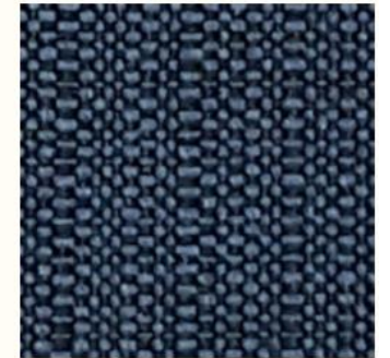
34 LIGHT BLUE