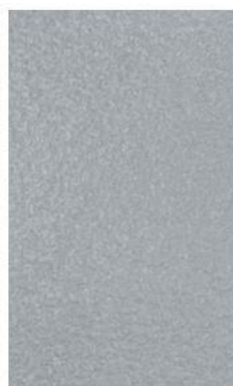
GRIGIO ARGENTO SILVER GREY RAL 9006