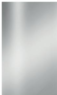
CROMATO / CHROMED