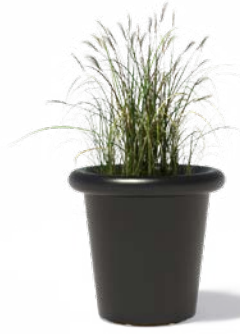
TUBE (BESCHICHTETEM STAHL)