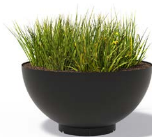
BOCCA (BESCHICHTETEM STAHL)