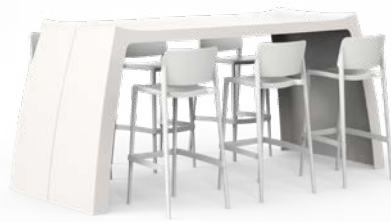
ORIGINAL HIGH TABLE