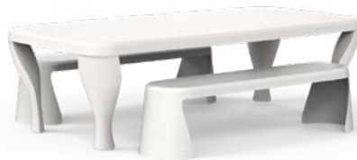
BAROK TABLE AND BENCH