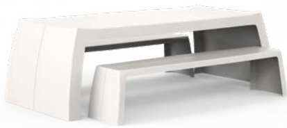
ORIGINAL TABLE AND BENCH

Eine vollständige Übersicht aller Modelle und produktspezifischen Optionen finden Sie unter www.onetosit.com