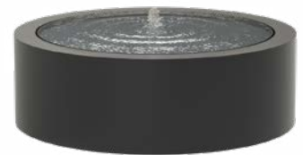
WASSERTISCH RUND ALUMINIUM