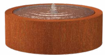
WASSERTISCH RUND CORTEN