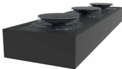
WASSERTISCH MIT SCHALEN ALUMINIUM