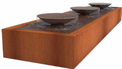
WASSERTISCH MIT SCHALEN CORTEN