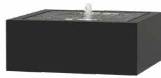
WASSERTISCH QUADRAT ALUMINIUM