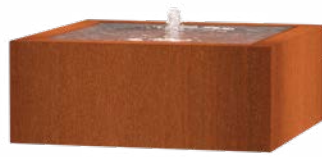
WASSERTISCH QUADRAT CORTEN